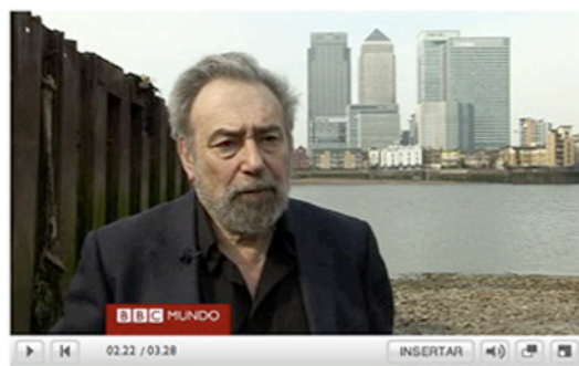
Alan Ereira, Sunstone Films