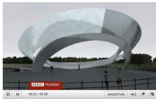
Aluna 3D movie, Mark Glean

http://www.bbc.co.uk/mundo/cultura_sociedad/2010/05/100526_video_aluna_am.shtml